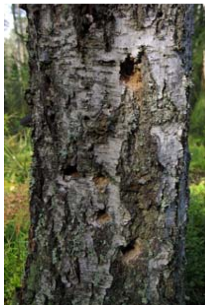
Tikan syönnösjälkiä alueen koivupökkelöissä, osa syönnös jäljistä on aivan tuoreita.