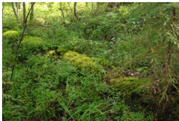
Lahoja koivupökkelöitä ja pitkälle maatuneita maapuita, jotka ovat paksun sammal kerroksen peitossa.