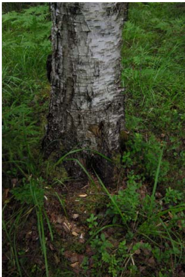
Tuoreita tikan syönnösjälkiä lahossa lepässä ja koivussa (kuvattu 27.7.2008)