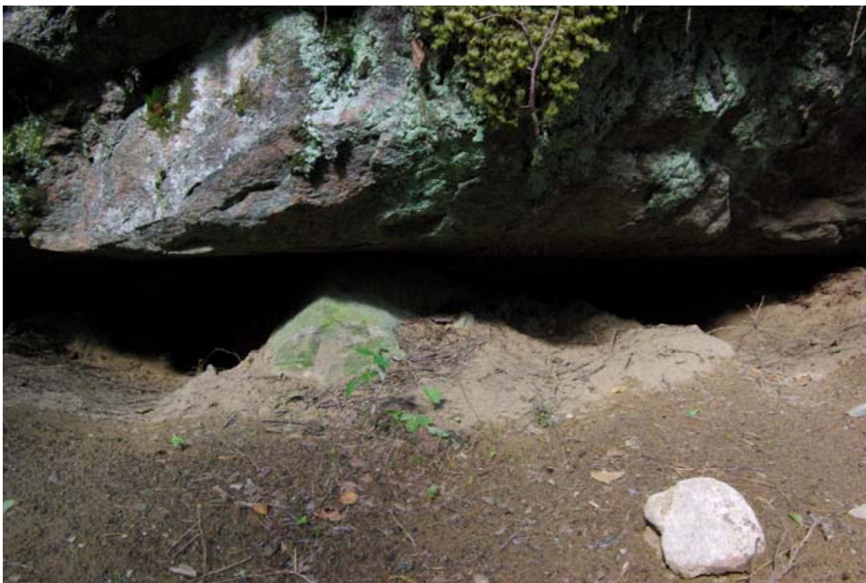
Mäyrän pesäkolo, pesäkolo oli asuttu, kaivaukset olivat tuoreita (kuvattu 27.7.2008)