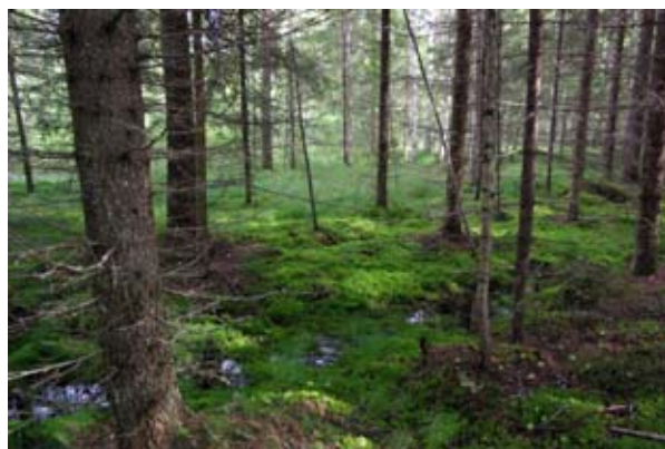
Rehevän aluskasvillisuuden seassa on pitkälle lahonneita maapuita. Mäen itäpuolella on kostea räme.